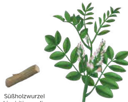
Süßholzwurzel Liquiritiae radix