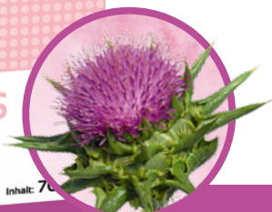
Silybum marianum (Mariendistel)