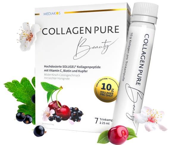
COLLAGEN PURE Beauty 10 g Kollagen Trinkampullen Inhalt: 7 x 25 ml. PZN: 16401385

**entsprechen einer 4-fach höheren Dosis als bei herkömmlichem Beauty Trinkkollagen