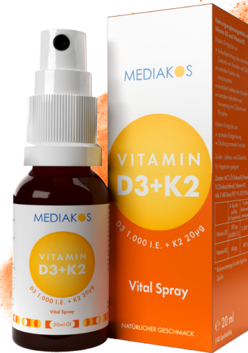
MEDIAKOS Vitamin D3 + K2 1.000 I.E. / 20 µg. Vital Spray Inhalt: 20 ml. PZN: 18133279