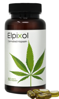
Elpixol Cannabisöl Kapseln 60 St. PZN: 17902764 UVP: 29,95 €