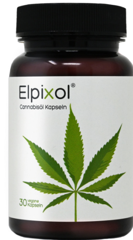
Elpixol Cannabis Kapseln Inhalt: 30 Stk. PZN: 18319133