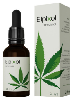
Elpixol Cannabisöl Tropfen 30 ml PZN: 16612544 UVP: 39,99 €