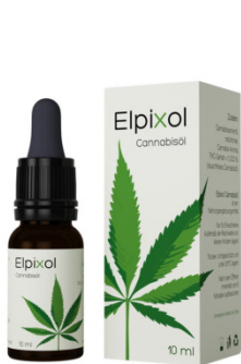
Elpixol Cannabisöl Tropfen 10 ml PZN: 16612550 UVP: 19,99 €