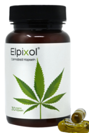
Elpixol Cannabisöl Kapseln 30 St. PZN: 18319133 UVP: 17,95 €