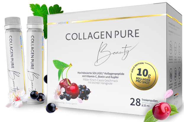
COLLAGEN PURE Beauty 10 g Kollagen Trinkampullen Inhalt: 28 x 25 ml. PZN: 18674696

**entsprechen einer 4-fach höheren Dosis als bei herkömmlichem Beauty Trinkkollagen