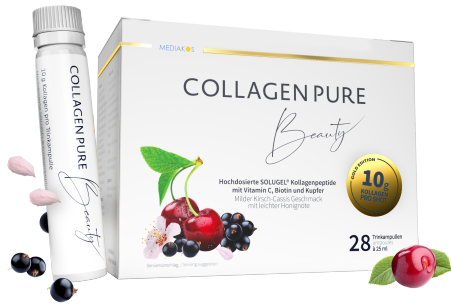
COLLAGEN PURE Beauty