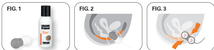
FIG. 3: Agora mova-se enquanto segura o treinador.