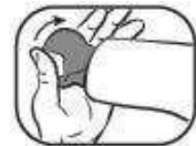
2. Applikator abdrehen