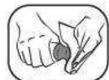
8. Bei Bedarf Applikator mit Papiertuch reinigen