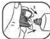
3. Mit seitlicher, sternförmiger Vertiefung das Sicherheitssiegel der Tube entfernen