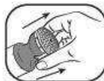
5. Zum Öffnen weißen Teil des Applikators hochziehen