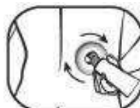
7. Applikator schließt sich beim Auftragen mit leichtem Druck automatisch