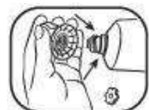
4. Applikator wieder auf die Tube drehen